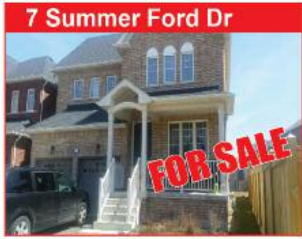
7 Summer Ford Dr