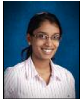
ஞா. ஆரணி அகவை 17

இந்தப் படத்தில் கனவு காண வேண்டும் என்பது ஒரு முக்கிய கருத்து ஆகும். மகள்தான் தாயின் கனவு, ஆனால்