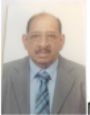
Math tutorial 328