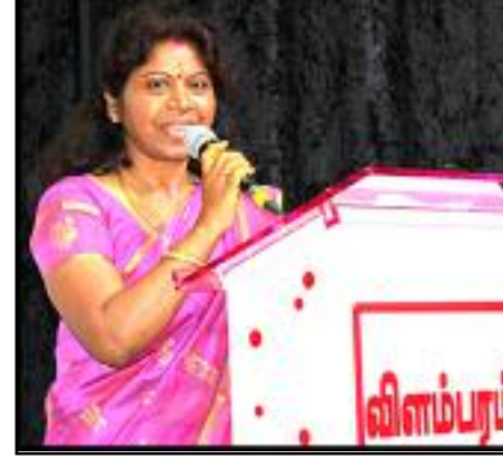
- வீரகேசரி மூர்த்தி -