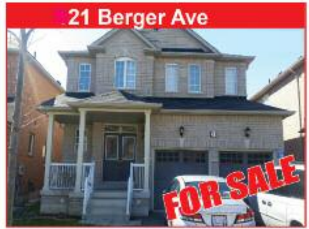
21 Berger Ave